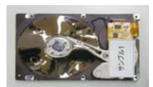
ハードディスク物理破壊処理写真

CD・DVD等の光メディアには物理破壊による消去を行います。また、データ消去後の処理についてもご相談ください。 お客様のお手間もゼロです!