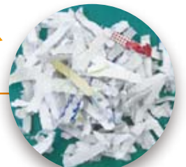
幅1cm長さ5cmにスパイラルカット