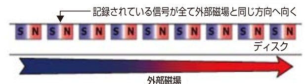
図2:オンサイトZEROによる消去の模式図