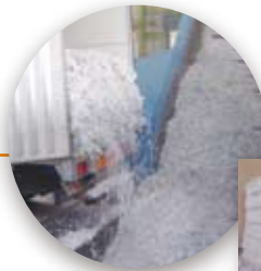
裁断後は再生資源化登録店にて再生紙原料に加工

裁断後は、再生資源化登録店にて 再生紙原料 として加工します。その後、製紙メーカーに搬入されます。