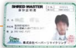
シュレッドマスター登録証

シュレッドマスターの資格保有者のみ裁断作業をおこないます。 シュレディングのプロフェッショナル にお任せください。