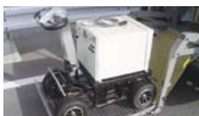
移動用電動キャリー