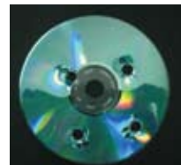
CD物理破壊処理写真