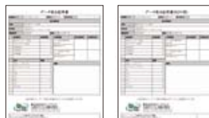
データ消去証明書