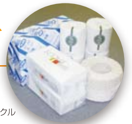
様々な製品にリサイクル